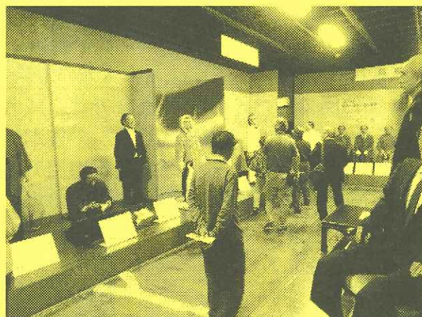
(東北の偉人と学級生)