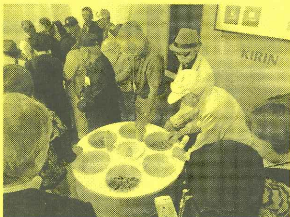
(原料の麦芽・ホップに触れる学級生)