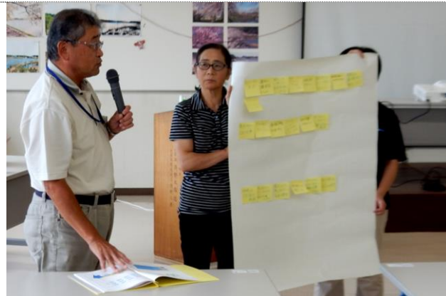
(現状と課題を各班でディスカッション)

今後、吉田地区の皆様にご協力をお願いする予定です。より良い地域づくりのため、ご協力をお願いいたします。地域づくり計画は今年度中の完成を目指します。