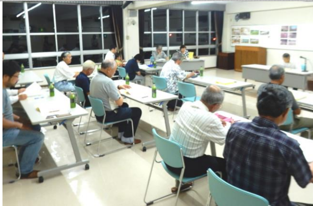
(第1回委員会へお集まりいただいた委員の皆様)